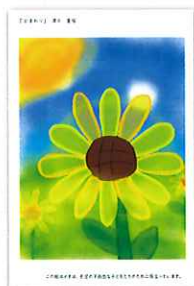
「ひまわり」 (コンピュータアート) 須永 愛桜