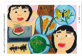
「虫のかんさつ」 (絵画) 星野 莢