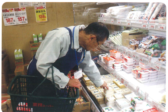
今日は何を作ろうかな～?