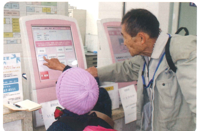
今日は混んでるかなあ?