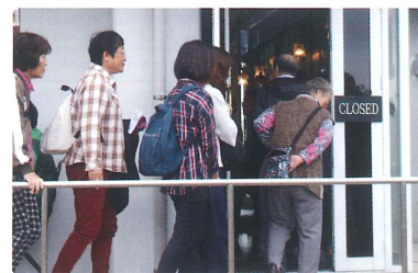
(わたげワークスを見学中)