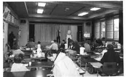
飯島所長と利用者さん