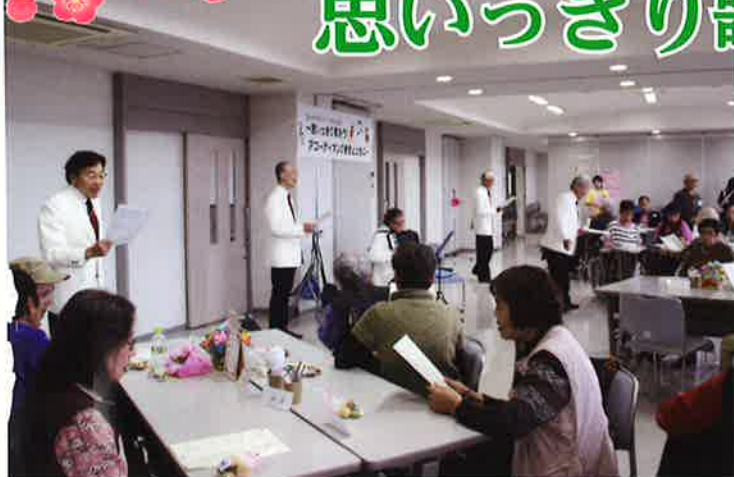
ジュンヤ&カルテットをお招きして、歌声喫茶を開店!

11月20日(木)、沼南社会福祉センター3階で、全体交流会を行いました。交通の便があまりよくない場所でしたが、ご夫婦で、また協力会員さんと利用会員さんが一緒に等、多くの方にご参加いただきました。