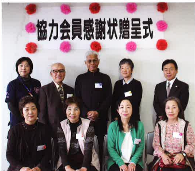
顕彰者の皆さん、笑顔で記念撮影 (平成26年度の対象者16名中7名の方)