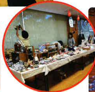
手作り雑貨屋さん