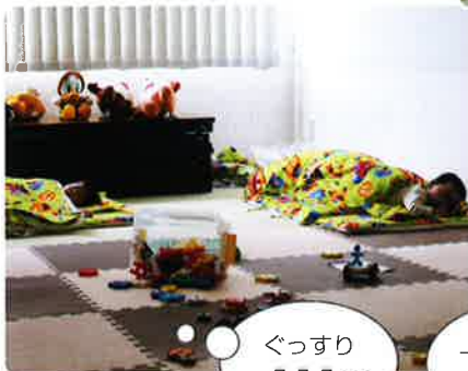
ぐっすり Z Z Z...