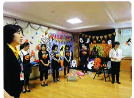
スタッフの皆さん