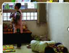
ねむくなってきた～