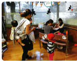
オイルハンドマッサージ