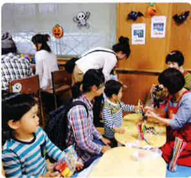
おもちゃで遊ぼう