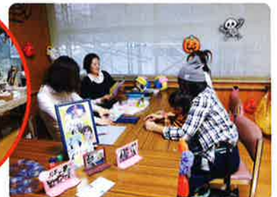
手作りフォトスタンド教室