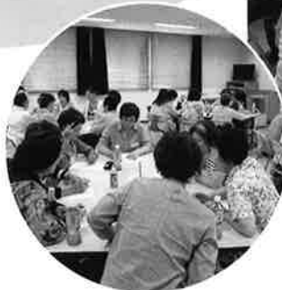
飛び出すカード完成！