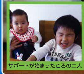
サポートが始まったころの二人