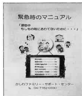
緊急時のマニュアル