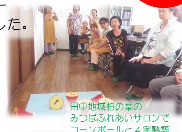
田中地域柏の葉の みつばふれあいサロンで コーンボールと4字熟語