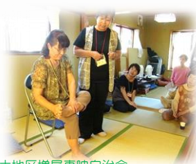
土地区増尾東映自治会 サロン「お茶でもいかがですか」で