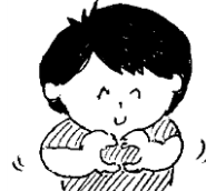
胸の前で両指で小さな輪