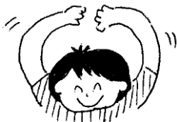
頭の上に両手で大きな輪