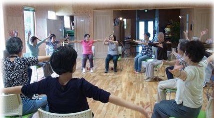
柏中央羽黒台町会 ふれあいカフェで