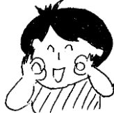
おかめのお面のようにほっぺにOKの輪