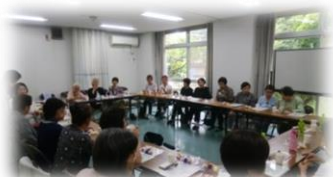
みんなでホッと一息。楽しいお茶の時間♪

日時 第3水曜日13時～15時 場所 松葉町4丁目第2住宅管理組合集会所 参加費 300円 対象者 4-2町会加入者