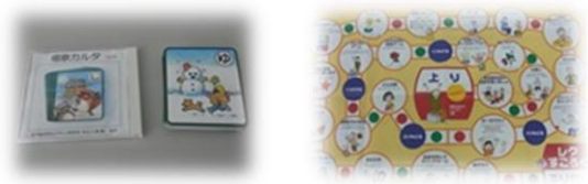
食後のゲームの時間に介護予防グッズを ご利用いただいております♪

日時 第3日曜日12時～14時 場所 松葉町5丁目第2住宅管理組合集会所 参加費 500円 対象者 松葉町5-2在住の方