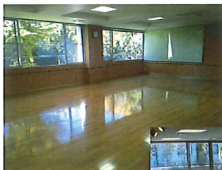
レクリエーション室