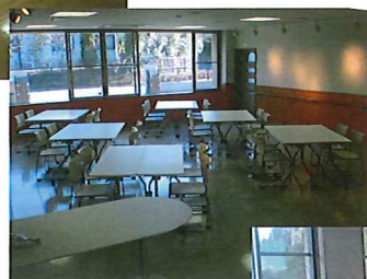
オープンラウンジ