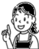
コーディネーター

Aさんは普段から信頼関係を築いた方が支援に来てくれることもあり、普段の生活の安心感につながりました。また、たすけあいサービスのコーディネーターさんから体調面で不安があるときなどは、連絡をもらえるようになり、デイサービスの入浴前の体調チェックで不安な点を看護師に確認できるようになりました。