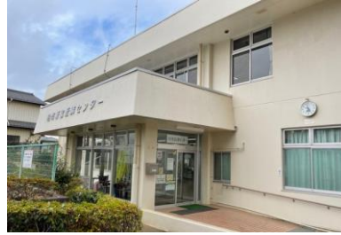
柏市新富近隣センター