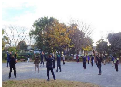
伊勢原ふるさと公園でのラジオ体操