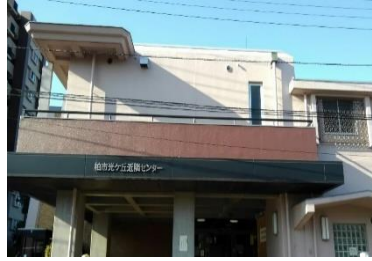
柏市光ヶ丘近隣センター