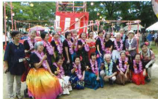
町会の夏祭りでは、「ものがたり広場」で練習したダンスを元気いっぴりに発表して盛り上がりしました。