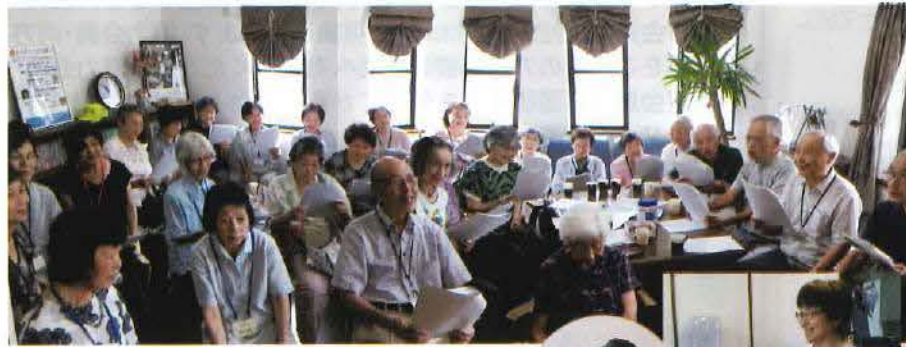
指揮者選曲の今月の歌をエレクトーンにあわせみんなで歌いました。