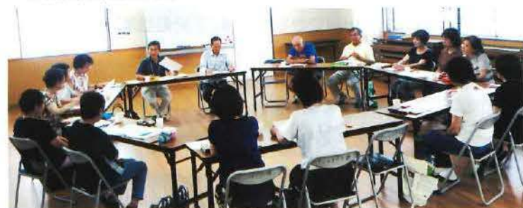
それぞれの活動の報告と次の活動について話し合います。