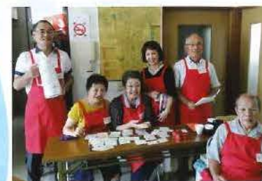
ボランティア活動を楽しんでいます。

● 「コミュニティのこのこ」は、ふる協協賛です。いろいろな町会から来ていただいております。