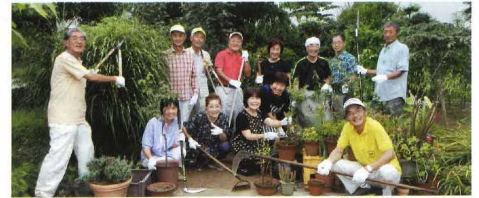
庭木の伐採や草取りなどに積極的に活動をしています。

地元ではほとんど活動したことがなかったので、始めは躊躇しましたが、今では、あちらこちらからボランティアのお声がかかるようになり、週2回くらいのペースで活動しています。