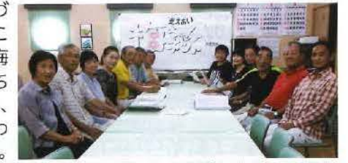
町会長を中心に話し合って活動をすすめています。