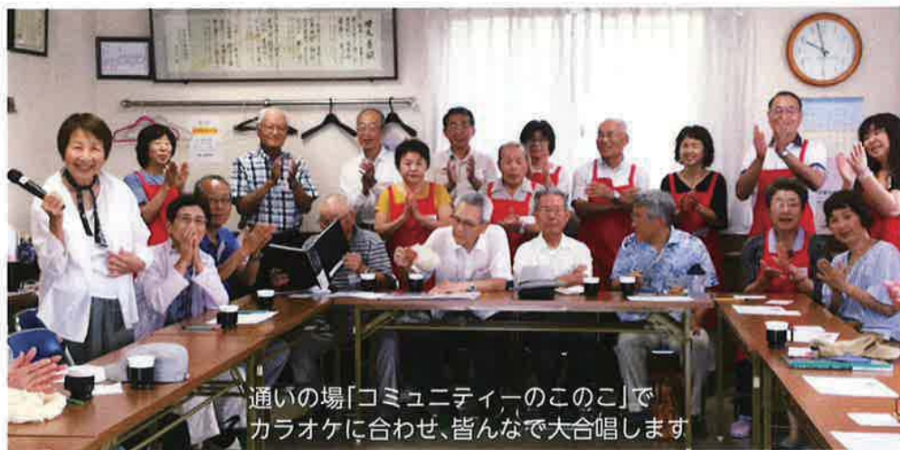
通いの場「コミュニティのこのこ」でカラオケに合わせ、皆さんで大合唱します