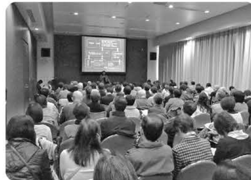
社会的関心の高さから、ひきこもり親セミナーでは多くの来場者が参加

昨今の若年者等のひきこもりが社会問題化する中、制度の狭間にある課題にいち早く着目した先駆的かつ継続的な取組みが、他の模範となる事例であるためこの度の受賞となりました。おめでとうございます。