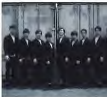
DAZZLE (ダズル) [ダンスカンパニー] (後期ダンスコース)

など、身体と感覚を自由に開放し、個性や感性を刺激する表現を生み出す活動を幅広く展開している。2008年にトヨタコレオグラフィアワードで「次代を担う振付家賞 (グランプリ)」を受賞。2012年フランス・パリ市立劇場 [Danse Elargie] では10組のファイナリストに選ばれた。