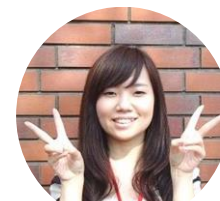
豊四季台・豊四季台西・高田地区