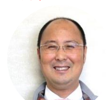
大津ヶ丘・塚崎地区