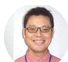
藤心・酒井根地区