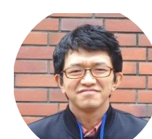
豊四季台・豊四季台西地区