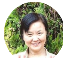
永楽台・富里地区