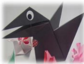
おしゃべり カラス