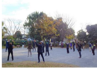
伊勢原ふるさと公園でのラジオ体操