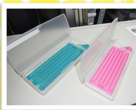
点字を打つ体験・練習ができます。 【数量】220個