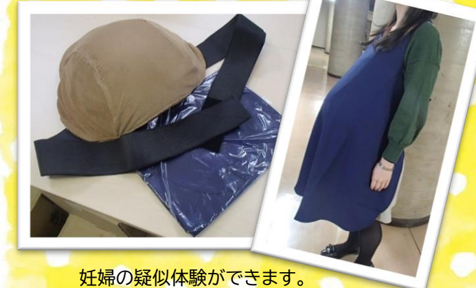
妊婦の疑似体験ができます。 【数量】3個