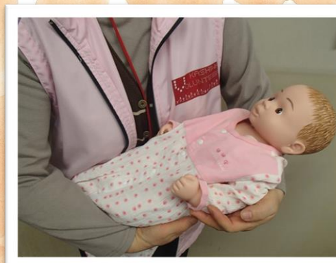
赤ちゃんのお世話体験ができます。 【数量】5体