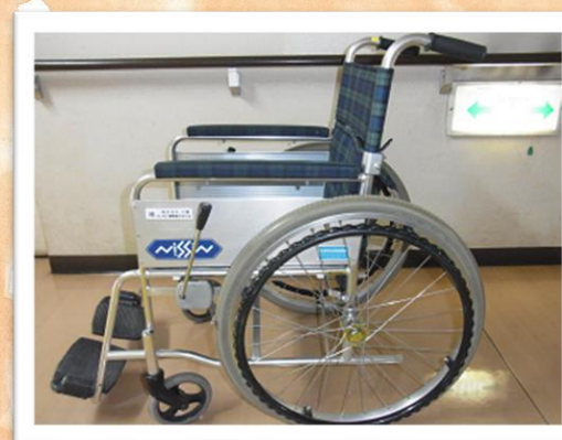
操作方法や介助体験ができます。 【数量】20台