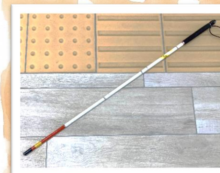
目が見えない方の体験と介助体験ができます。 【数量】 白杖 100 cm×40本 120 cm×20本 点字ブロック 2セット