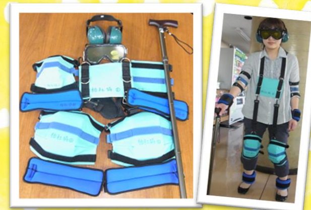
高齢による身体の状態を疑似体験できます。 【数量】30セット