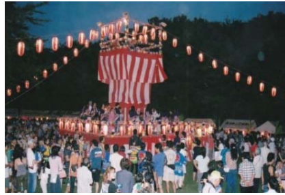
松葉町ふるさと祭り