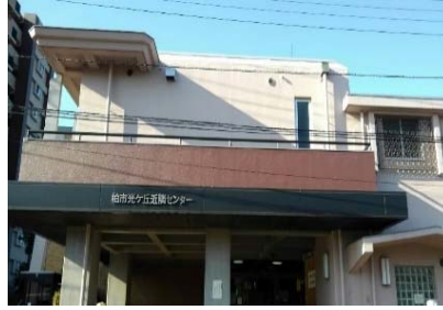
柏市光ヶ丘近隣センター