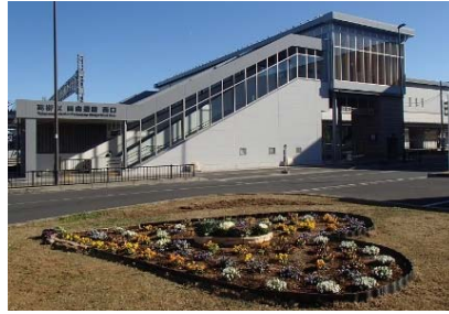
高柳駅前ロータリー