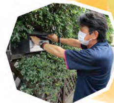
△決定通知書の投函

今度また予防注射でお願いします。いつも病院に行くときはこらくだくんで助かっています