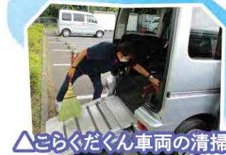
△こらくだくん車両の清掃