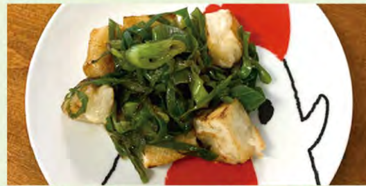
お酒の肴には醤油と七味でしょっぱくするのも美味しそう♪