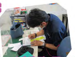
△事務所に戻って精算や事務仕事