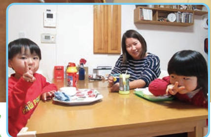
※写真撮影のため、一時的にマスクを外しています。