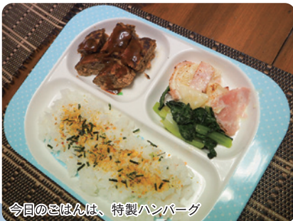
今日のごはんは、特製ハンバーグ