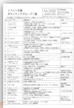
②イベント支援 ボラグループ一覧