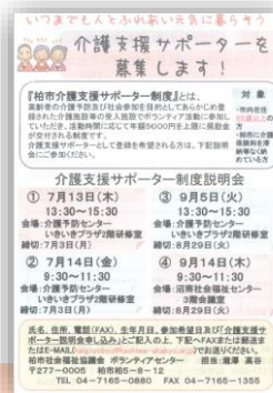
③介護支援サポーター登録説明会案内