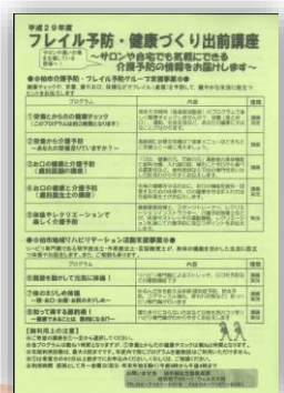
④フレイル予防・健康づくり出前講座 (柏市福祉活動推進課主催)