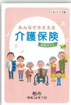
みんなで支える介護保険 発行/柏市役所高齢者支援課 TEL 7167-1111(代)