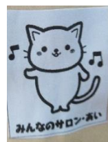
マスコットの「あいちゃん」♡