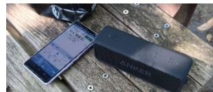
音源はスマートフォンとBluetoothを活用！