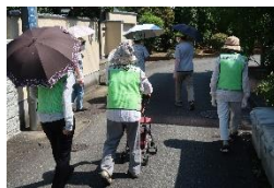
元気の源、防犯パトロール♪