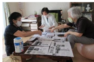
印刷物を組み合わせていくスタッフのみなさん