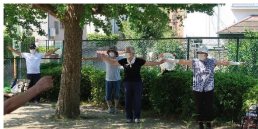
ラジオ体操、第1、第2を毎週行っています。

時間を決めて集まるだけなので、負担感はないです。雨天の中止の連絡も近いのですする必要もないですね。音源をもって来る人や、水分をもって来る人など役割をみんなで分担できています。