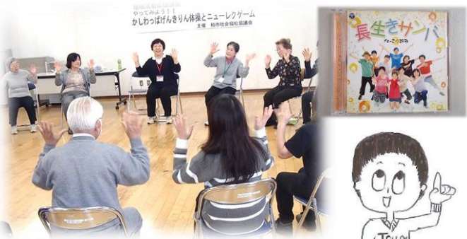
みんな / リ / リ、ビバビバ!!