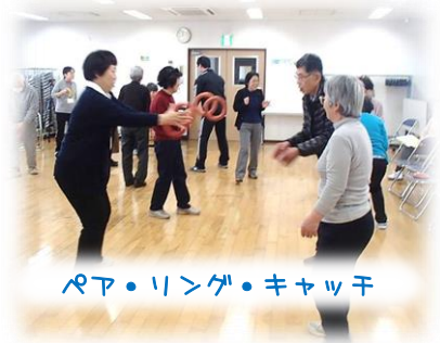
ペア・リング・キャッチ

長さ1mのスティックを、床にトントンと打ち、IPの掛け声でスティックを倒さず、人が右隣に移動するチームワークのゲーム