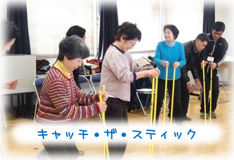
キャッチ・ザ・スティック

長さ1mのスティックを、床にトントンと打ち、IPの掛け声でスティックを倒さず、人が右隣に移動するチームワークのゲーム