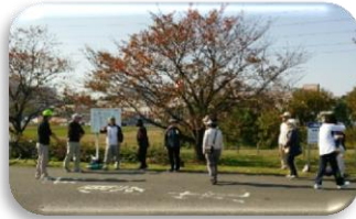
ウォーキング前の準備体操

まずは町会内で情報交換できる仲間を作ることが大事！これからもウォーキングの会を続けていくことで参加者が増えて町会内のつながりができていくと思います！