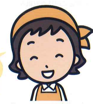
■プロフィール：柏市在住28年。夫・母・長男(大学生)・長女(高校生)の5人家族。民生委員歴3年。

方面委員は 民生委員 と改称されました。 (方面委員制度が全国統一の制度となる)