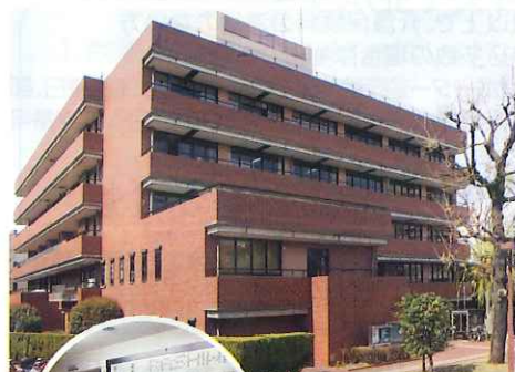
地域福祉センター (教育福祉会館内)