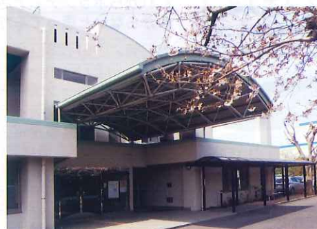
沼南社会福祉センター