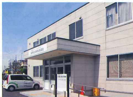
介護予防センター いきいきプラザ